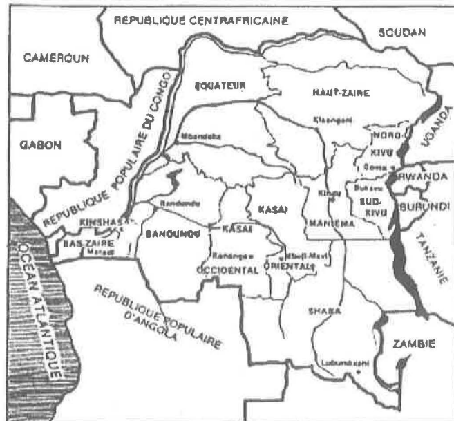
Carte 2 : Bukavu dans son contexte provincial et régional