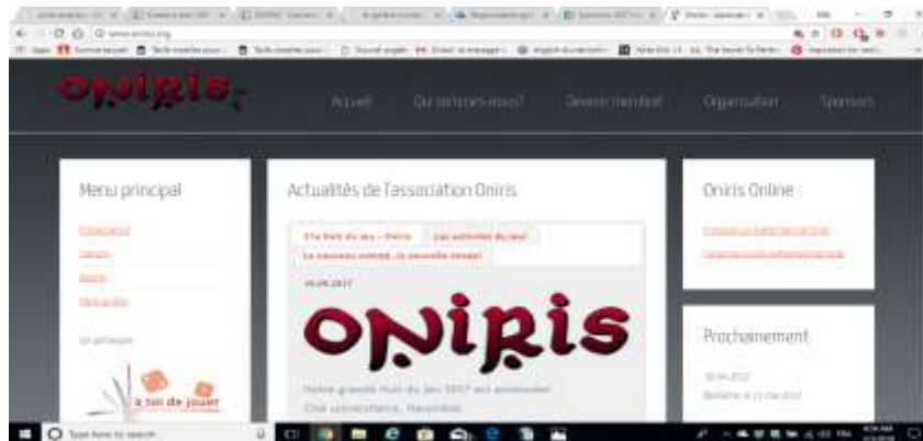
Tableau 1 : Vue du Homepage d'Oniris

Actuellement, leur page n'a pas beaucoup changé. 7 Il reste aéré mais terne et peu accueillant.