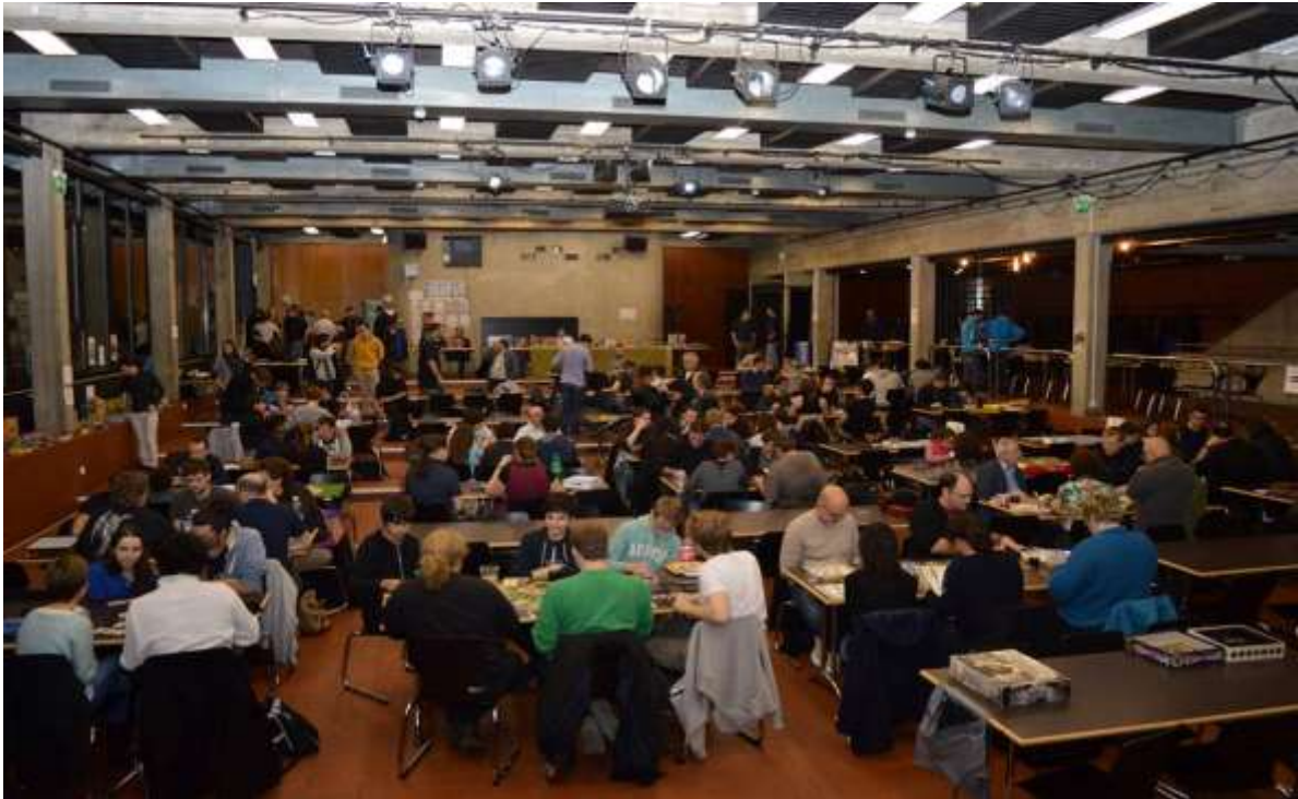
19ème Nuit du jeu, presque comble à 20h malgré ou peut-être en réponse à l'attaque sur le Bataclan de la nuit précédente.

Notre discussion, qui a sauté d'un sujet à l'autre, est aussi forcément passé par la Nuit du Jeu de 2015, qui a eu lieu le lendemain de l'attaque sur le Bataclan, à Paris.