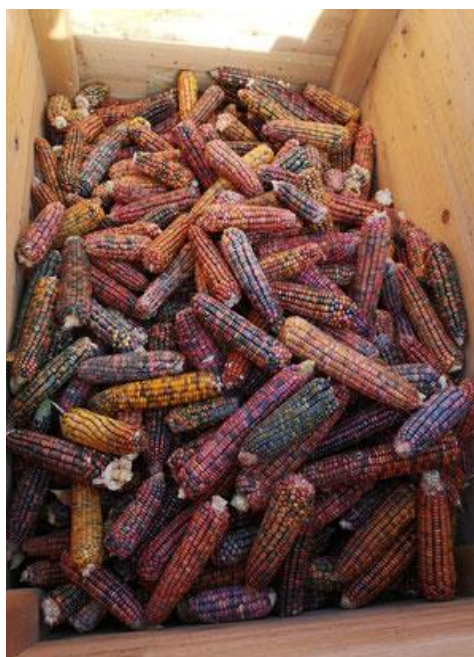
Image 7: Maïs multicoloré pris lors de la participation à la récolte

Pour moi c'était clair que je veux produire de la nourriture humaine. Comme ça, on a commencé avec l'avoine et on a stoppé avec l'orge, parce que c'était pour les animaux. On n'a plus de maïs pour les animaux, ils ne mangent que de l'herbe. Et les lentilles, c'est super, pas seulement pour les végétaliens, parce qu'il y a beaucoup de protéines dedans. Et la polenta... j'aime le maïs, je trouve c'est une plante super et il y a aussi des sortes multi couleurs qui sont supers à voir, et c'est comme une passion à moi. (Producteur, entretien)