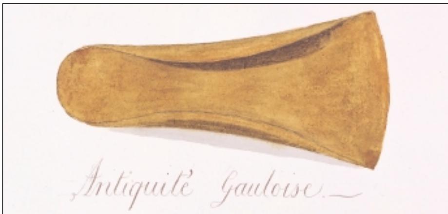
Fig. 1. Qualifiée d'«Antiquité Gauloise», cette hache plate en bronze mise au jour dans la carrière de Tête Plumée en 1753 constitue le premier vestige préhistorique reconnu comme tel dans le canton de Neuchâtel. Aubert PARENT, Recherches sur les Antiquités de la Principauté de Neuchâtel en Suisse , 1807.

Dombresson 2 . Auparavant, et à l'exception de quelques gloses et mentions assez fantaisistes dans les Annales historiques de Jonas Boyve 3 , on ne peut guère remonter que jusqu'en 1807 pour identifier le premier témoignage écrit d'un intérêt proprement archéologique dans le Pays de Neuchâtel. Il s'agit d'un mémoire manuscrit sur les Antiquités de Neuchâtel , enrichi par des aquarelles de trouvailles sommairement déterminées, remis en hommage au Prince Berthier par l'architecte et sculpteur français Aubert Parent 4 (fig. 1).