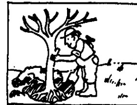
Der Mann pflanzt einen Baum

Die folgenden Bilder zeigen je nach Betrachtungsweise eine Handlung, einen Vorgang oder einen Zustand