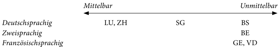
Abbildung 1. Ausgewählte Kantone nach Sprachregion und Grad der Unmittelbarkeit der Hauptverhandlung gemäss kantonomer Strafprozessordnung und Praxis

Die Anzahl Akten pro Kanton und Jahr ist Tabelle 1 zu entnehmen. Die Aktenzahl variiert nach Kanton, weil die Erhebung aus forschungsökonomischen Gründen nur für ausgewählte Kantone über 20 Akten hinaus vertieft wurde. 13