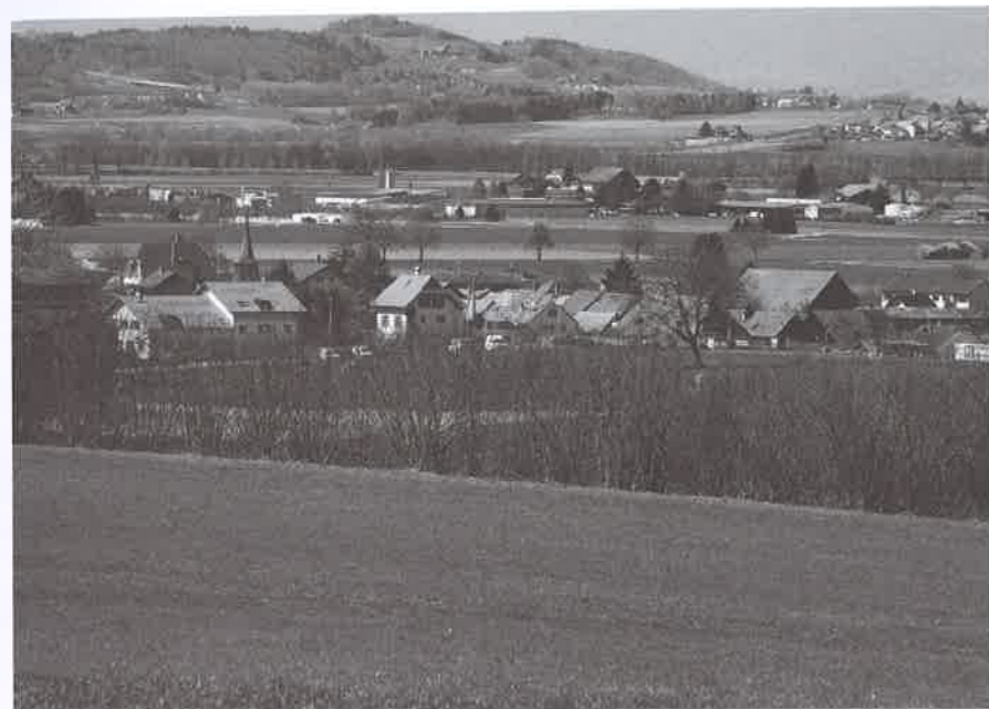
Lors d'une réduction du CUS afin de sauvegarder la typologie d'un village, il ne faut pas perdre de vue le principe de l'utilisation mesurée du sol.

Tribunal fédéral semble étonnamment accepter que le problème du surdimensionnement de la zone à bâtir que connaît Corcelles-près-Payerne reste irrésolu.