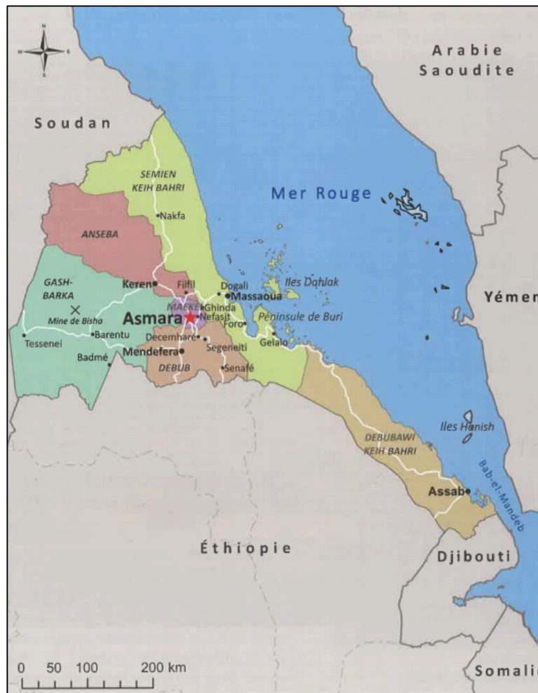
Figure 1 : Erythrée et pays limitrophes (GOUERY et JEANGENE VILMER 2014 : 7)

L'Erythrée est un pays dont la superficie est plus ou moins équivalente à celle de la Grèce. Elle est bordée par le Soudan au nord et à l'ouest, par Djibouti au sud-est et par l'Éthiopie au sud. La mer Rouge la sépare à l'Est de l'Arabie Saoudite et du Yémen. La capitale est Asmara, ville située à 2400 mètres d'altitude. Une des particularités du pays, est le nombre d'ethnies différentes qui y vivent : officiellement neufs, pour trois langues – dont les principales sont le tigrinya et l'arabe – et deux religions, à savoir le christianisme et l'islam (GOUERY et JEANGENE VILMER 2014 : 9-10).