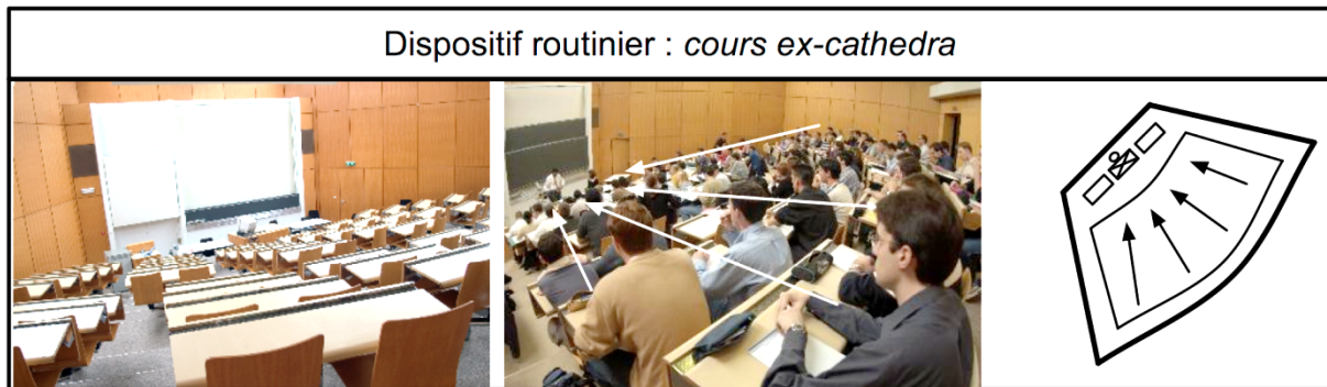
Fig.2: La salle de cours comme espace quotidien.

L'utilisation ordinaire de ce dispositif est particulièrement routinière: un participant, sis dans le point focal, parle face à d'autres qui sont assis et dirigent – plus ou moins exclusivement – leur attention vers lui. Dans la salle de cours en question (débat ETU-EMP), ce dispositif est contraignant au point que les chaises et les tables des gradins sont fixées au sol. Les événements s'y succèdent d'après un horaire contraignant, les agents impliqués dans cette activité collaborative (orateur-enseignant et public-étudiant) se renouvelant régulièrement au fil de la journée.