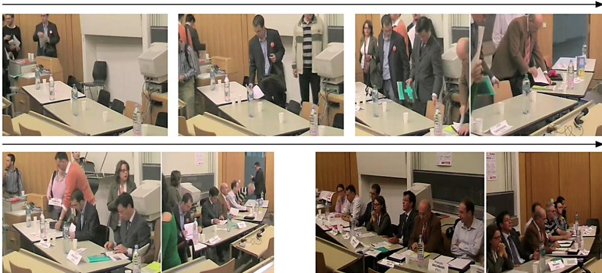
Fig.4: La prise de place comme incorporation d'un dispositif proxémique.

Intuitivement, cette série de captures vidéo laisse bel et bien entrevoir quelque chose de l'ordre du prendre place. On voit des individus s'approcher, successivement ou simultanément, de la série de tables, saisir une chaise et s'y asseoir. Cette prise de vue pose néanmoins problème: elle ne permet de considérer qu'une partie du processus et laisse hors champ l'incursion des personnes dans la salle. Un extrait, tiré d'un autre événement du corpus, va permettre (i) d'analyser la manière dont les participants s'orientent vers l'accomplissement méthodique d'une prise de place, (ii) d'identifier les actions qui participent de cet accomplissement et, finalement, (iii) de voir en quoi ces actions s'articulent à la construction de l'espace interactionnel public proposé par les organisateurs. Intervenu alors que l'événement a déjà commencé, mais sans pour autant provoquer d'interruption dans l'activité en cours, la prise de place que documente l'extrait est donc au bénéfice d'une certaine saillance perceptuelle qui permet de la considérer de manière relativement autonome et détaillée.