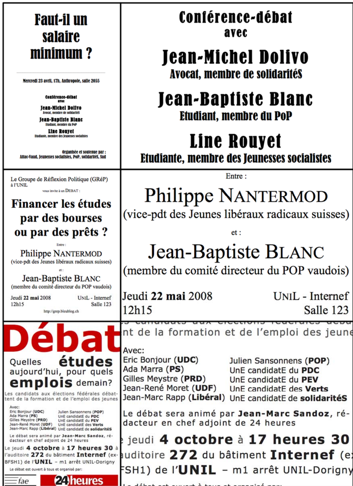
Fig.1: les affiches des débats SAL-MIN, PRE-BOU et ETU-EMP (la colonne de droite propose un agrandissement de la zone pertinente).