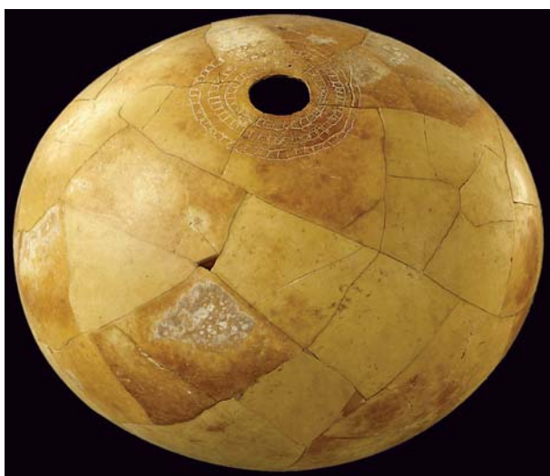
Fig. 1: Œuf d'autruche gravé découvert sur un habitat du Mésolithique, vers 7500 av. J.-C.

Le site de Kerma, de par sa richesse, occupe une position centrale dans l'archéologie de la Nubie et du nord du Soudan. Rendu célèbre il y a 10 ans à l'occasion de la découverte de sept statues de pharaons noirs, il représente également un lieu important pour la préhistoire de la vallée du Nil et de l'Afrique. Depuis bientôt 20 ans, un programme de recherche s'est développé sur l'évolution de la société, depuis les premiers établissements sédentaires il y a 10'000 ans jusqu'à l'émergence du royaume de Kerma, il y a près de 5'000 ans. Entre Nil et Sahara, les variations environnementales ont eu de tout temps des conséquences importantes sur le peuplement et le mode de vie de ces sociétés humaines.