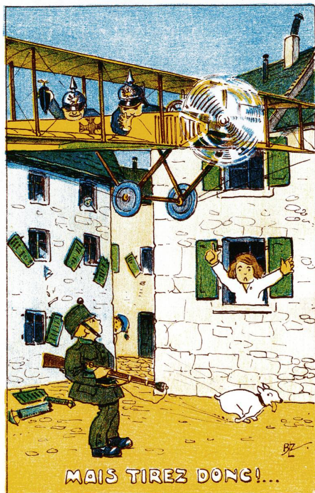
Fig. 4: Carte postale de B.L.Z., Mais tirez donc!... , s. l. n. d.

l'occupation de l'Alsace par l'Allemagne et l'espoir suscité chez une jeune fille par l'arrivée d'une hirondelle venant de France. L'éditeur de la carte postale satirique fait de cet oiseau français un avion allemand venu attaquer le Jura. Ainsi les paroles originales: « Un petit oiseau printanier / vint montrer son aile d'ébène. » deviennent « Un aéroplane étranger / vint pour nous bombarder sans gêne. » Une carte similaire, au dessin plus enfantin, montre la scène avec deux aviateurs munis d'un casque à pointe, dont l'un fait un pied de nez à la sentinelle helvétique (fig. 4). La veine satirique est porteuse et une dernière image se moque de la passivité de soldats suisses tenant des lampions pour signifier à un avion allemand où se situe la frontière (fig. 5). La plupart de ces œuvres sont jugées suffisamment démobilisatrices pour justifier l'intervention de la censure fédérale.